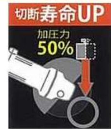
イメージイラスト